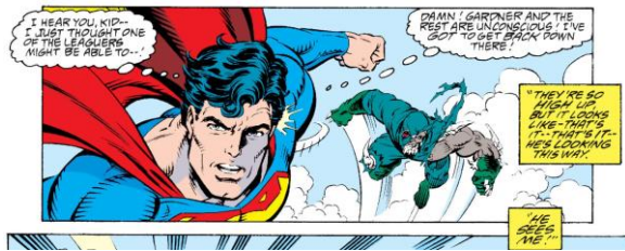
Gambar 3 (Jurgens, Ordways & et al, 1993: 77)

I hear you, Kid—I just thought one of the leaguers might be able to --! Damn! Gardner and the rest are unconscious! I've got to get back down there!