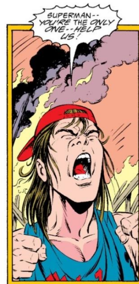
Gambar 2 (Jurgens, Ordways & et al, 1993: 76)

Superman – You're the only one – Help Us!