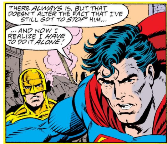
Gambar 5 (Jurgens, Ordways & et al, 1993: 94)

There always is, but that doesn't alter the fact that I've still got to stop him ... and now I realize I have to do it alone!