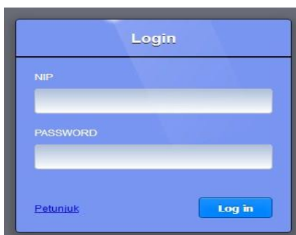
Gambar 1 Form Login

Pada gambar 4.1 merupakan form yang digunakan oleh admin untuk masuk ke sistem informasi Penilaian Kinerja Pegawai Pada Operasi Perangkat Daerah Kecamatan Rantau Utara, langkah-langkah pengisian form login antara lain adalah, admin harus mengisikan username dan password kemudian setelah terisi klik login, jika login gagal maka akan muncul pernyataan anda gagal login, jika berhasil maka akan langsung masuk ke halaman utama admin, kemudian halaman utama sistem informasi Penilaian Kinerja Pegawai Pada Operasi Perangkat Daerah Kantor Camat Rantau Utara akan terbuka.