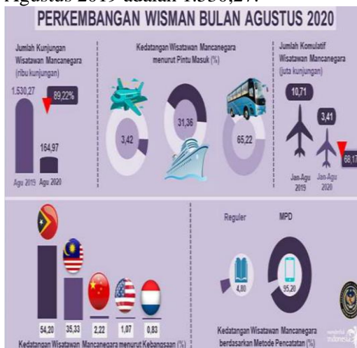
Gambar 1 Perkembangan Wisatawan Mancanegara Bulan Agustus 2020

Berdasarkan kebangsaan, jumlah kunjungan wisatawan mancanegara pada bulan Agustus 2020 di seluruh pintu masuk jumlah pengunjung tertinggi, yaitu: Timor Leste sebesar 88.408 kunjungan, Malaysia sebesar 58.291 kunjungan, Tiongkok sebesar 3.655 kunjungan, Amerika Serikat sebesar 1.768 kunjungan, dan Belanda sebesar 1.367 kunjungan wisatawan mancanegara. Jumlah kunjungan wisatawan mancanegara pada bulan Agustus 2019 adalah 1.530,27.