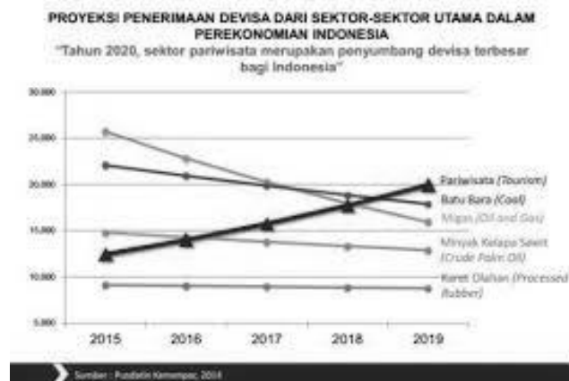
Gambar 2. Proyeksi Penerimaan Devisa dari Sektor Perekonomian Indonesia