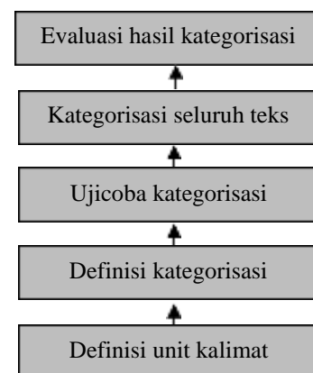
Gambar 1. Alur Analisis Data

Analisis data menggunakan metode kategorisasi Weber (Faturochman, Minza, & Nurjaman, 2017). Kategorisasi melewati beberapa tahap yaitu melakukan definisi unit, menetapkan definisi kategorisasi, menguji coba kategorisasi, menerapkan ketegorisasi pada seluruh teks, serta mengevaluasi dari hasil ketegorisasi (lihat Gambar 1)