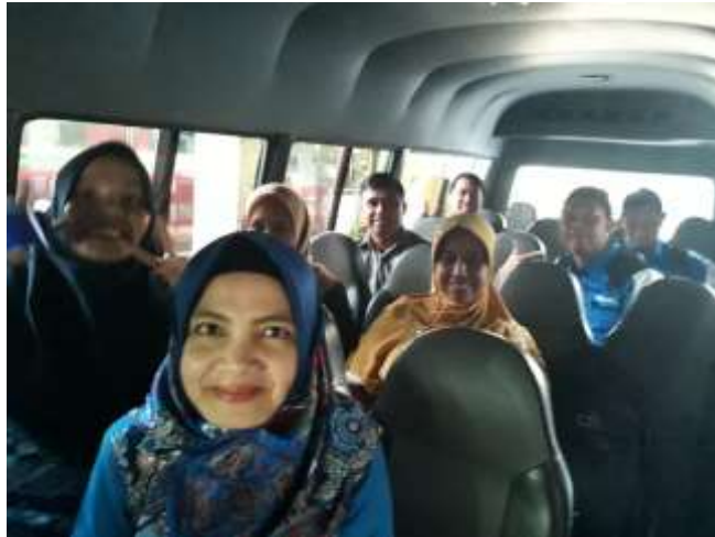
Gambar.2 Keberangkatan Tim PKM Menuju Desa Pematang Serai