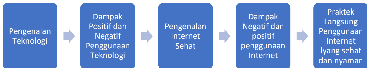
Gambar.1 Prosedur Kerja Tim Pengabdian Kepada Masyarakat

Dalam memudahkan tim Melaksanakan PKM di desa Pematang Serai dengan lancar dan sukses maka tim melakukan Pemetaan dengan prosedur kerja. Adapaun prosedur kerja yang dilakukan oleh Tim adalah sebagai berikut :