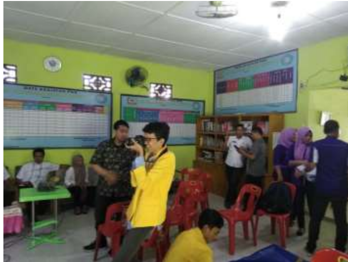
Gambar.5 Tim Dibantu oleh dua orang mahasiswa Sistem Komputer UNPAB