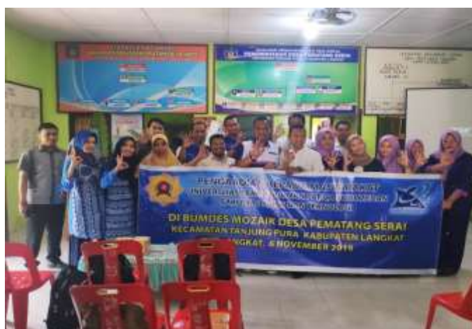
Gambar.4 Foto bersama Tim PKM dengan Anggota BUMDES Mozaik