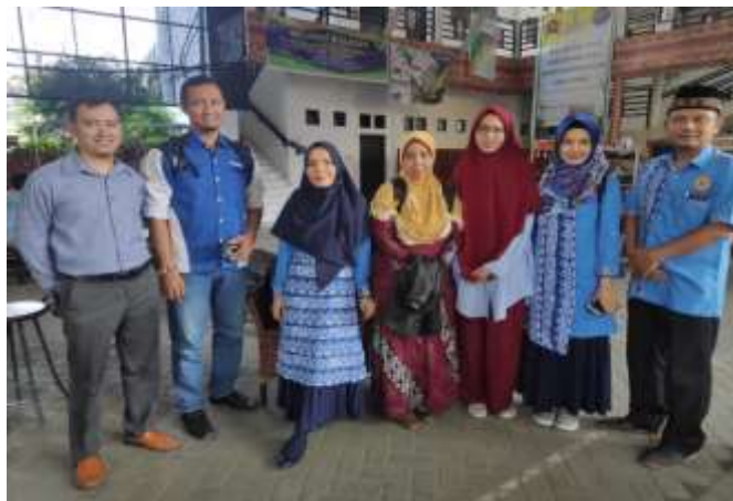
Gambar.3 Foto Tim PKM yang terdiri dari dosen dan mahasiswa UNPAB