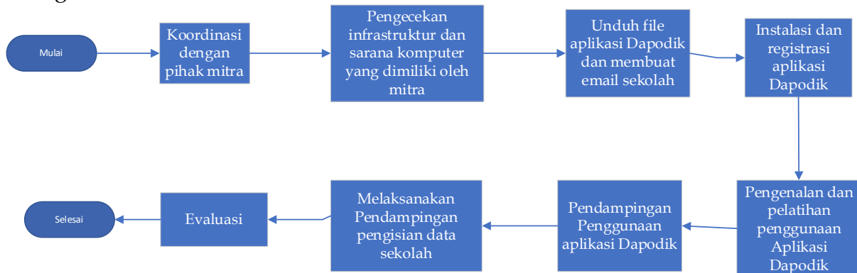
Gambar 1. Diagram alur kegiatan pengabdian kepada masyarakat

Pelatihan dan pendampingan aplikasi Dapodik Paud dan Dikmas untuk operator sekolah TKA-T Hayaatul Ilmi dilaksanakan melalui beberapa tahapan antara lain, lihat gambar 1: