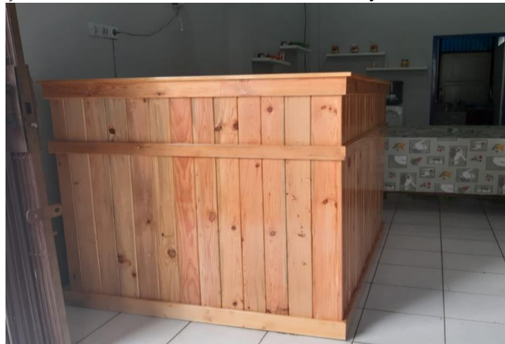
Gambar 1. Meja Bar

Pembelian meja bar dilakukan untuk memaksimalkan pelayanan pada Café Herbal J&J. Meja bar didesain secara minimalis menyesuaikan luas café.