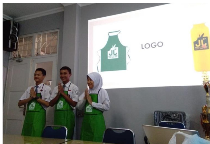
Gambar 2. Praktik melayani konsumen

Pelayanan prima kepada pelanggan merupakan salah satu aspek yang sangat penting diperhatikan dalam merebut simpati konsumen sehingga konsumen memilih produk yang ditawarkan. Seiring perkembangan teknologi, pelayanan prima dilakukan tidak hanya secara tatap muka, tetapi secara online juga dibutuhkan dalam menarik perhatian konsumen. Cafe herbal J&J yang baru memulai bersaing dalam dunia kuliner juga tidak terlepas dari persaingan usaha yang sejenis. Melalui pelatihan pelayanan prima kepada pelanggan ini, diharapkan cafe J & J mampu meningkatkan penjualan dan lebih dikenal masyarakat. Pelatihan pelayanan prima dilaksanakan pada tanggal 21 Juli 2019 dengan diikuti oleh guru bidang keahlian Farmasi Klinis dan Komunitas, perwakilan siswa bidang keahlian farmasi klinis dan komunitas, pengurus business centre , dan perwakilan petugas kantin di SMK Negeri 1 Purwokerto.