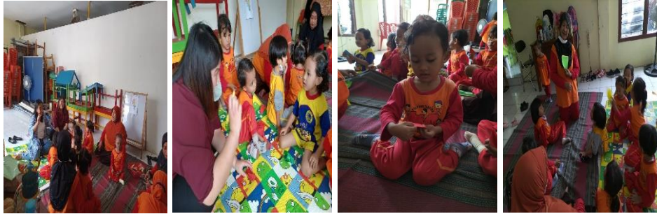
Gambar 3. Praktik Peningkatan Literasi Keuangan terhadap Siswa PAUD

menyisihkan uang jajan siswa PAUD hingga manfaat yang diperoleh ketika seseorang dapat mengelola keuangan dengan baik.