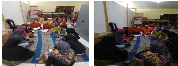
Gambar 4. Pengarahan Literasi Keuangan pada Ibu Guru serta Wali Murid PAUD

Selanjutnya, tindak lanjut kami sebagai Tim Pengabdian Masyarakat adalah bersama orang tua atau wali murid evaluasi berdiskusi bersama untuk cara-cara sederhana supaya para siswa PAUD tidak melupakan untuk menyisihkan atau menyisihkan uang jajannya bersama dengan Ibu Guru PAUD, seperti pengingatan kepada siswa setiap pulang sekolah menabungkan sebagian uang jajan dan tujuan hasil tabungan siswa. Dalam hal ini kegiatan menabung juga merupakan suatu proses secara psikologis (Yusbardini & Darryl, 2022). Dengan demikian, para siswa dapat belajar dan terkontrol supaya tidak menghabiskan uang jajan dan dapat mengurangi sifat konsumtifnya.