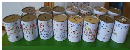
Gambar 5. Hasil Kegiatan Pengabdian Masyarakat bersama Siswa PAUD

Siswa diminta untuk angkat tangan ketika ingin menjawab pertanyaan tersebut. Pada gambar 5 menunjukkan celengan siswa yang telah diberikan stiker dan hiasan kertas lipat. Hal ini diperoleh dari hasil tanya-jawab tersebut. Semua siswa berhasil menjawab dengan benar dan diberi stiker. Bentuk stiker yang diberi dalam bentuk gambar peralatan sekolah, makan, minuman, fasilitas rumah, serta pakaian, untuk menunjukkan hasil tabungan dapat dibelikan sesuai kebutuhan setiap orang.