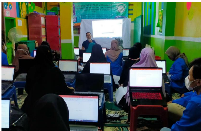
Gambar 2. Pelaksanaan pelatihan

Pada pelaksanaan, peserta dengan jumlah 19 orang yang merupakan pengurus dan para staf TPQ Nurul Jihad Jakarta Utara, peserta sudah mengenal PowerPoint namun belum memahami menggunakan efek animasi. Sebelum pelatihan dilaksanakan, peserta diberikan survei untuk mengetahui tingkat pemahaman terhadap materi yang akan diberikan.