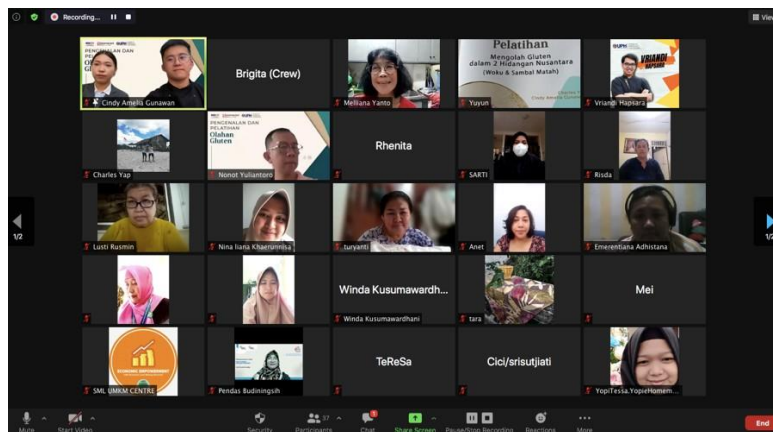
Gambar 2. Peserta Menyimak Pemaparan Materi

Metode yang diterapkan dalam pemaparan materi ini adalah melalui presentasi dan pembinaan, serta diskusi kepada para peserta. Sasaran utama pengenalan dan pelatihan ini adalah ibu-ibu binaan di SML UMKM Centre (Rumah Pintar BSD). Materi yang diberikan pada saat kegiatan Pengabdian kepada Masyarakat adalah mengenai seitan, sejarah singkat, karakteristik, pola makan sehat, pola makan sehat di Indonesia, dan penampilan video mengenai cara pembuatan seitan. Setelah dibekali pengetahuan dasar mengenai seitan, peserta kemudian menyimak pelatihan melalui live cooking kemudian mereka diberi kesempatan untuk membuat kedua hidangan tersebut sendiri dan kreasi hidangan nusantara menggunakan seitan sebagai pengganti protein hewani.