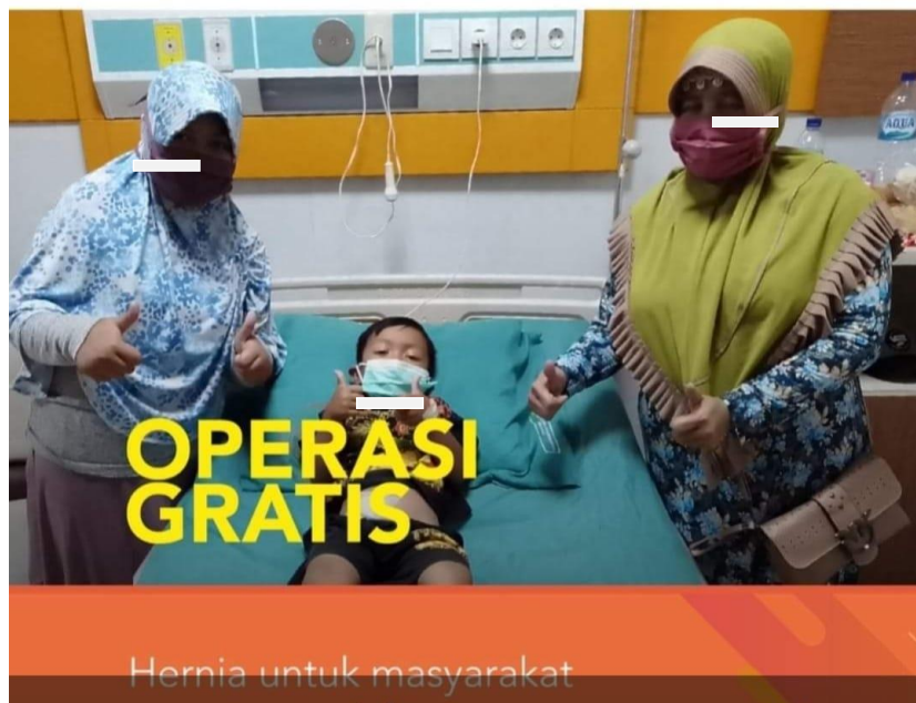
Gambar 2. Pelaksanaan program operasi hernia gratis

Tindakan medis prosedur operasi hernia dapat dilakukan baik itu operasi terbuka maupun operasi laparoskopi. Pertama, operasi hernia terbuka dilakukan dengan cara membuat sayatan di daerah selangkangan. Operasi tersebut biasanya lebih dianjurkan pada pasien hernia inguinalis yang menderita keluhan nyeri atau gangguan pencernaan. Operasi ini juga lebih disarankan untuk pasien dengan kondisi kesehatan yang baik. Kedua, operasi hernia laparoskopi merupakan operasi hernia yang dilakukan dengan melakukan sayatan kecil berukuran 1-2 cm pada bagian bawah pusar. Sayatan kecil ini dibuat untuk memasukkan alat yang disebut dengan laparoskop, sehingga dapat menangkap gambar organ dalam perut.