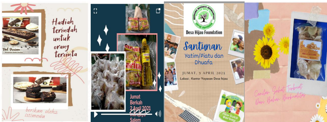
Gambar 2: Hasil Karya Peserta

Sedangkan hasil karya para peserta yang telah berhasil menyelesaikan tugas pembuatan banner dengan desain canva, adalah sebagai berikut: