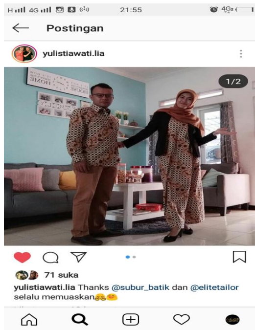
Gambar 5 Konsumen yang puas terhadap produk Subur Batik

Dibawah ini, merupakan data dari hasil penjualan setelah marketing subur batik menggunakan media sosial instagram sebagai strategi pemasaran untuk memasarkan batik: