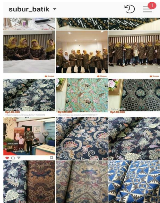
Gambar 4 Produk Subur Batik update di instagra