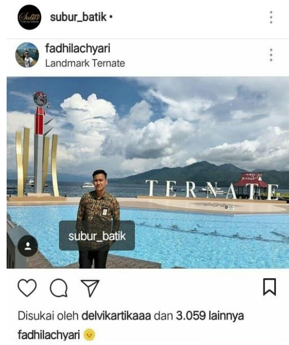
Gambar 3 Selebgram Subur Batik yang memiliki jumlah followers 50,1K PNS Kementrian dalam Negeri