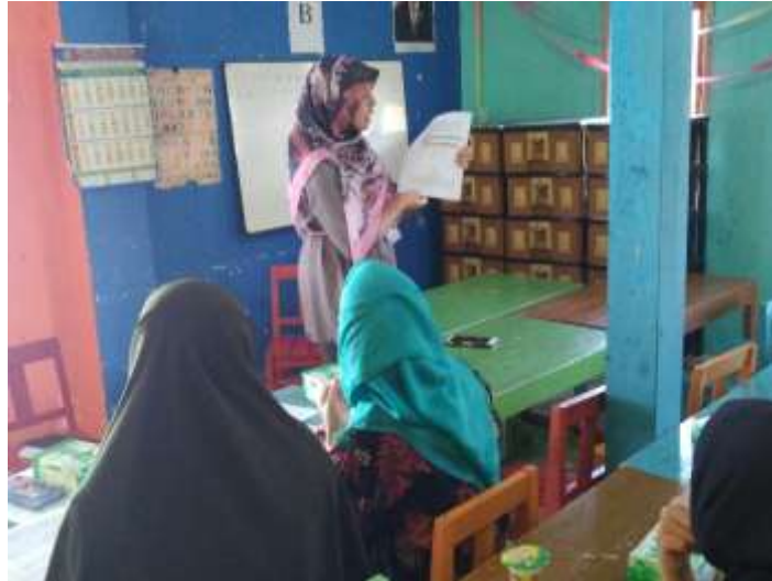
Gambar. 3 Dokumentasi Kegiatan Evaluasi

dipaparkan sebelumnya (Purnomo,2015). Masyarakat sasaran diberikan beberapa pertanyaan mengenai kasus nyata yang mungkin terjadi di lingkungannya. Lalu, masyarakat sasaran diminta untuk mengidentifikasi kasus tersebut dan memberikan solusi yang tepat terhadap tindak kekerasan tersebut.