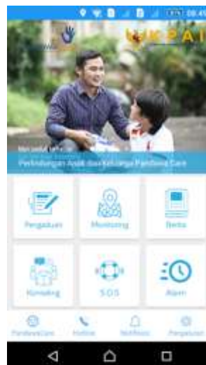
Gambar. 2 Tampilan Pandawa Care

Gambar. 1 menunjukkan tampilan dari layanan aduan daring versi web yang disediakan oleh KPAI. Halaman tersebut dapat diakses pada alamat www.kpai.go.id/formulir-pengaduan . Sedangkan Gambar. 2 menunjukkan halaman utama aplikasi Pandawa Care.